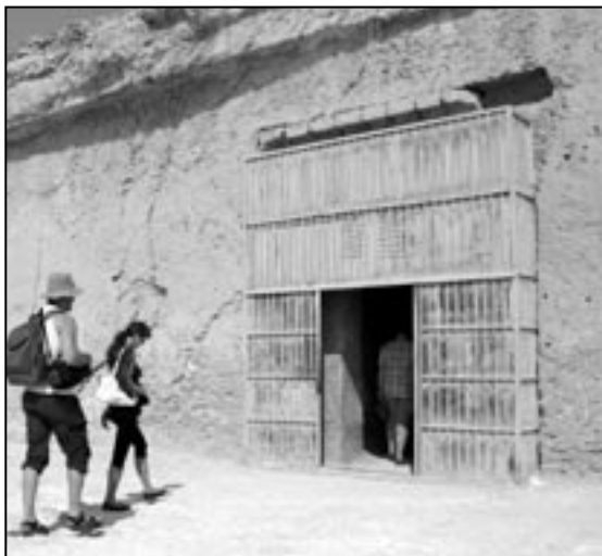
Sisäänkäynti Akhenatonin vuoristotemppeleihin.

Yksi ensimmäisistä matkakohteista oli Akhenatonin kaupunki Akhenaton Tel el Amarnassa. Matkasimme viisi tuntia linja-autolla erämaassa poliisisaatteen mukana ja saavuimme vuorelle, jonne hän rakennutti temppelinsä. Alhaalla näimme hämmöttävät kaukaiset vuoret ja sieltä aurinko nousee elä-