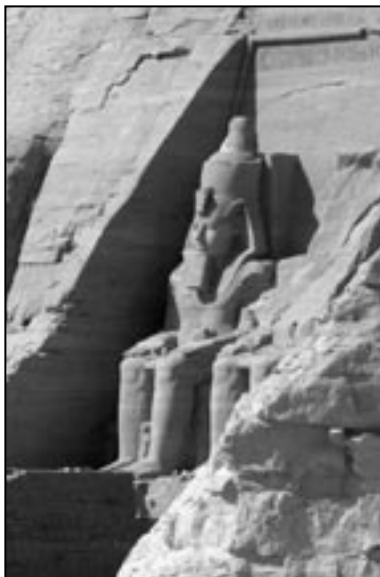
Ramses II, Abu Simbel, Egypti.