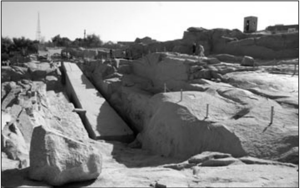
Keskenjäänyt obeliski Assuanin graniittikaivoksella.