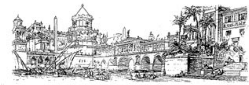
Aleksandrian satama. G. Ebers, 1885.

Aleksandriassa syntyi uutta alkemistista tiedettä, jonka aineksina käytettiin vanhoja egyptiläisiä menetelmiä ja kreikkalaista ajattelua. Se tarjosi todellista, uskonnon otteesta vapaata yleiskoulutusta. Aleksandrialaiset alkemistit pitivät tämän taidon perustajana Hermes Trismegistosta, josta tuli antiikin perinteen eteenpäin viejä. On syytä muistaa, että Kiinassa ja Intiassa jo tuolloin harjoitettiin alkemiaa. Aleksandrialaista alkemistia Bolos Mendesläistä (100 eKr.) on usein pidetty kreik-